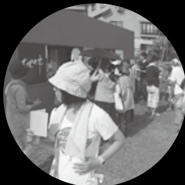
午後3時頃は大地の芸術祭のツアー客も訪れて、市がいちばん賑わう時間帯です。にんじんかき氷も人気。

よっこらしょ。建具をまたいだりくぐったりして作品の中を移動。最初はちよつと戸惑うけど、いざやってみるとみな楽しそうです。