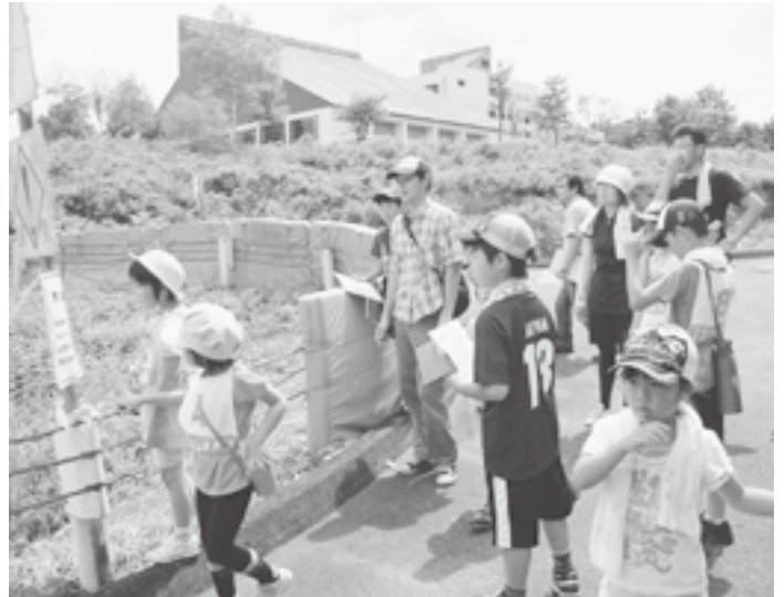
↑なぞなぞを解きながら歩く「親子なぞなぞウォークラリー」