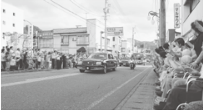
↑ 役場前を通過される天皇后陛下を見送る沿道の皆さん

長野県北部地震で被災して今も仮設住宅で暮らしているかたも多い長野県栄村を訪問するために、天皇后陛下が、国道 117 号を通過されました。