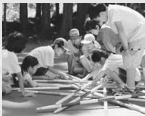
音が鳴らないように棒を抜いていくゲームです。

この作品は、まず「ミカドゲーム」について知らなければなりません。日本では、あまり聞きなれない「ミカドゲーム」は、重ねた棒を、将棋くずしの要領で崩さず音を鳴らさないで、棒を引き抜き得点を重ねるゲームです。本来は、竹串のサイズですが、この作品では、等身大まで棒を大きくし、実際に遊ぶことで、体感してもらおう作品です。