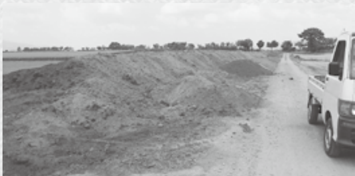
農道にはみ出す堆肥（沖ノ原地内）

作物にとって、堆肥などの有機体は良質な栄養素であり、野菜産地である当町農業は、この有機質を適正に利用し、常に消費者にアピールできる農業に取り組む必要があります。