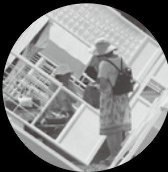
出店者こだわりの物産に来訪者も興味津々。商品をきっかりに会話も弾みます。

大地の芸術祭真つ盛りですね！毎週末開催されている大地の市にも遠方から多くの方が訪れています。今回はそんな市の様子をフォトレポートします。