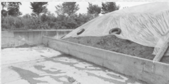
堆肥盤での適正管理（沖ノ原地内）