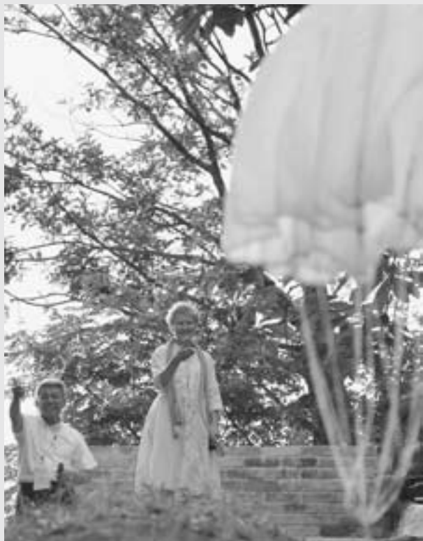
■A Cloud of Sound 9月16日(日)17:45~18:30 マウンテンパーク津南

田中集落の空家を使った作品でも、さまざまな「音」を楽しむことができます。どんな仕掛けがあるか、じっくり楽しんでください。