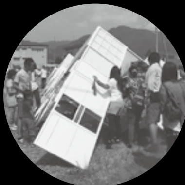
太田新田で作品展開するKEEN Japanも大地の市に臨時出店。開始早々から多くの人でごったがえしました。次回出店は8月26日の予定です。