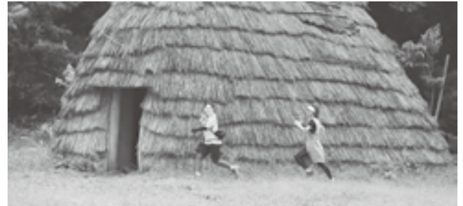
↑ 5人の鬼が、なじよもの敷地内に逃げ込んだ逃走者を追いこんでいく。一度鬼に見つかれば、まず逃げ切れない。

津南の若者がもっと楽しめるイベントをしたいと、Tap (タップ) が、企画した「onigame (オニゲーム)」というイベントが 7 月 14 日に開催されました。