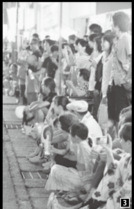
■巡礼-祈りの旅- 9月16日(日) 14:00~穴山