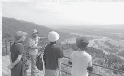
川の展望台は河岸段丘が一望できる人気のスポットです

もっと自分の住んでいるこの地域のことを勉強してみたい。人に話せるようになってみたい。など、ジオパーク学習に興味のあるかたが増えることは地域の活性化につながります。推進室では毎月講座を開いています。まずはこの地域の魅力を知り、家族や友人などにその魅力を話すきっかけとして、お気軽に講座にご参加してみてください。はいかがでしょうか。