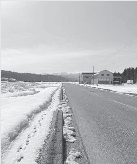
2月下旬の晴れた日に撮った1枚です。まだ地面は雪に覆われていましたが日差しの温かさや空の色は確実に春が近づいていることを実感できる一日でした。