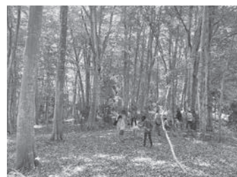
なじよものブナ林

日 時:4月29日(月・祝) 午前9時～11時 体験料:500円 ※友の会会員は半額 対 象:小学1年生～大人 なじよものブナ林を歩きながら自然観察を楽しみましょう。