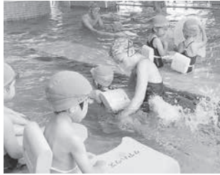
クアハウス津南 幼児水泳教室