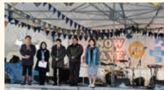
つなん雪まつりに友好交流都市である、韓国の驪州(リウジョウ)市、埼玉県の狭山市から訪問いただきました。

3月9日。まさに、春を告げる、春を呼ぶまつり。数年ぶりに制限のない形でつなん雪まつりを開催し、多くの町民、町外のお客さまから繰り出していただきました。これもひとえに、実行委員会の皆さまはじめ、関係各位のご努力の賜物であり、心より御礼申し上げます。