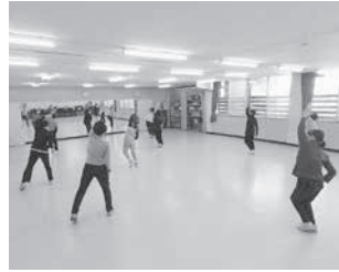
エアロビクス教室

子どもから大人まで、運動事業や文化事業を展開しています。 Tapと一緒に豊かな時間を過ごしませんか。