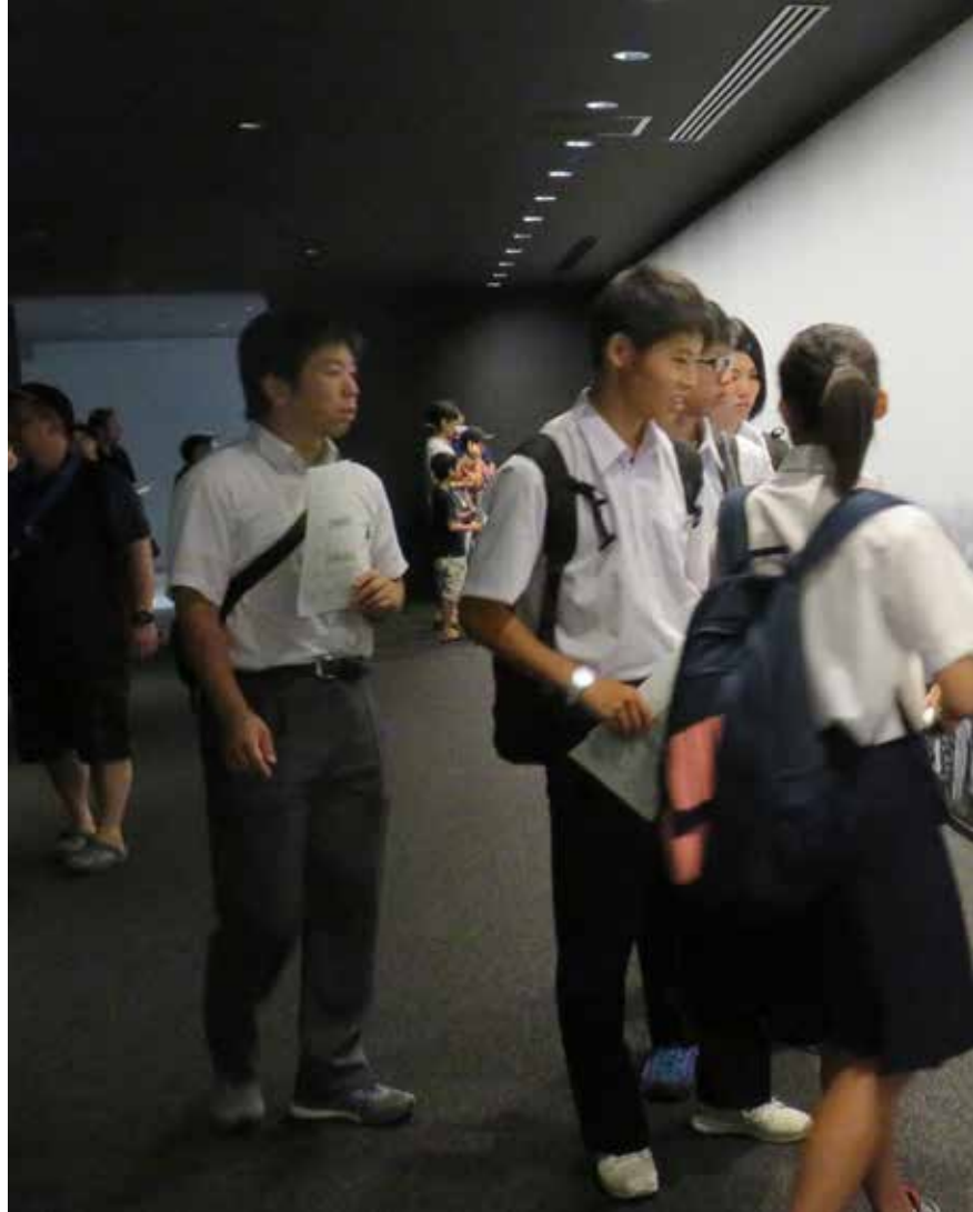
広島平和記念資料館に飾られる原爆投下後の街の風景写真に圧倒