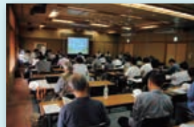
昨年のシンポジウムの様子