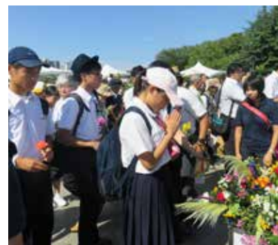
献花台に手を合わせ、世界平和を願う

今もなお、原爆で苦しんでいるかたがいます。二度とこのような事が起きないために、私達は何ができるでしょうか。世界の人々に、核兵器の恐怖や非人道性を伝え、ノーモア・ヒロシマと訴えたいです。そして、世界中の平和を共に願いたいです。