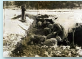
昭和31年第一次発掘調査風景

会期 / 9月2日(土)~11月5日(日) 津南町の本ノ木遺跡で1000点以上の石槍が出土しました。これらの資料が60年ぶりに津南町に戻ってきたことを記念し、一堂に会して展示します。