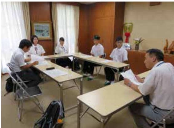
神田山やすらぎ園の小川園長（右）より施設概要を説明