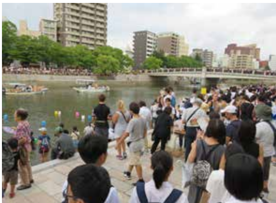
多くの人が灯籠に想いをのせました