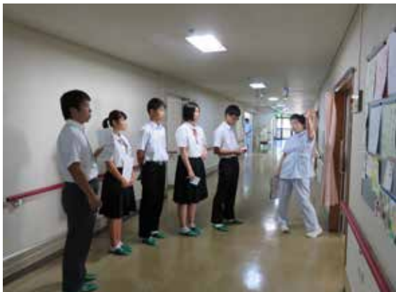
神田山やすらぎ園の施設見学