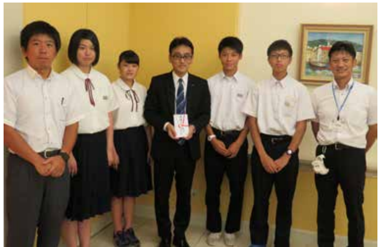
義援金を間所原爆被害対策部調査課長（中央）へ手渡しました