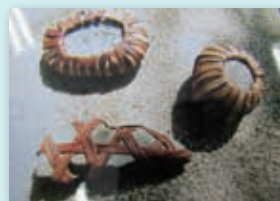
樹皮細工(ペーパーウエイト)