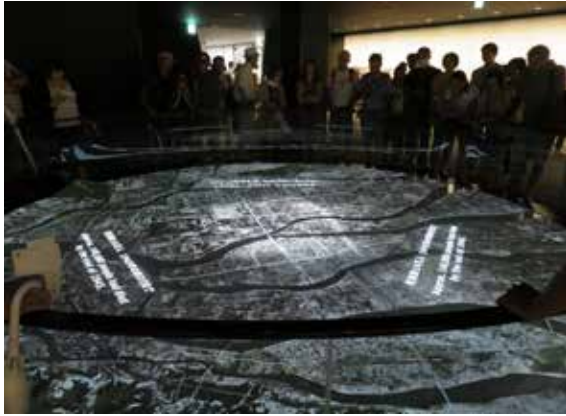
原爆が投下された再現映像が映し出されます