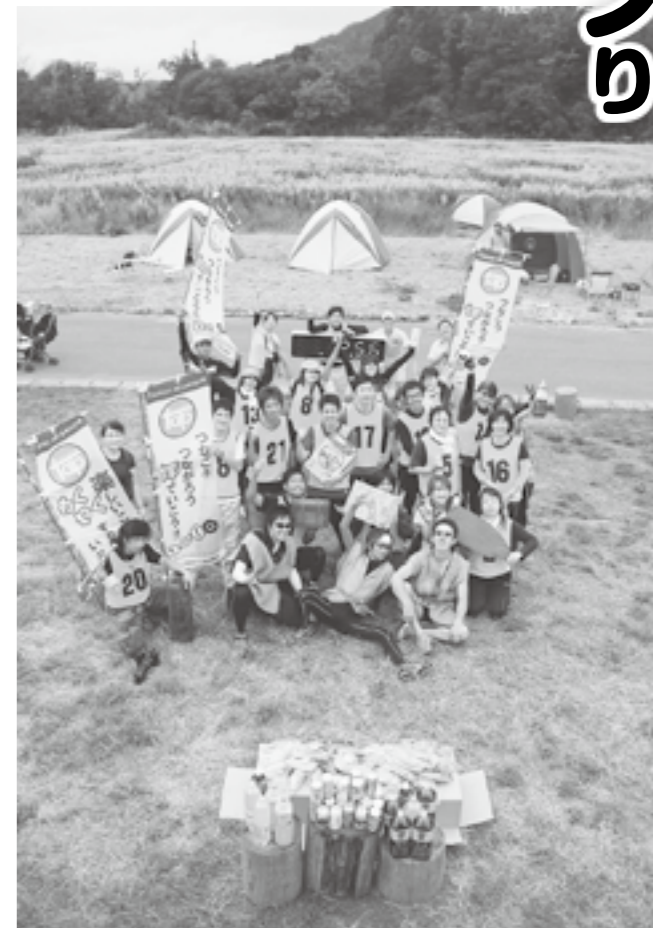
世代を超えた遊び「鬼ごっこ」をスポーツにした「oni game」