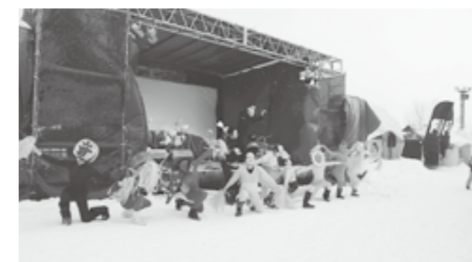
↑ 夏でも冬でもタイツ一枚!!おなじみ「S56」の寸劇

盛りだくさんのイベントで期待されていた、つなん雪まつりに寒波があたってしまいました。ライブや鳥追い、かまくらでのイベントは行われましたが、最大18m/sの猛吹雪となり当日用意されていたSNOWWAVEやスカイランタンなどのイベントが中止になってしまいました。この日を楽しみにしていた皆さん、また来年に期待しましょう。