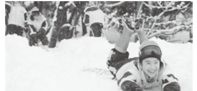
↑ 学校裏の山で、肥やし袋で滑り下りる子どもたち。

旧三箇小学校の空き校舎を使用して、都会の子どもたちを受け入れている三箇地区に、鎌倉小学校の子どもたちが、秋に続いて冬にも来てくれました。見上げるほどに積もった雪を見た子どもたちは、みんな大興奮。長靴に雪が入ってもお構いなしで、三箇の冬を味わっていききました。