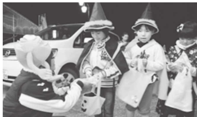
英語で遊ぼう!! では、ハローウィンもやりますよ。