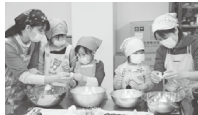
絵本に出てくるお菓子を作る料理教室も行いますよ。