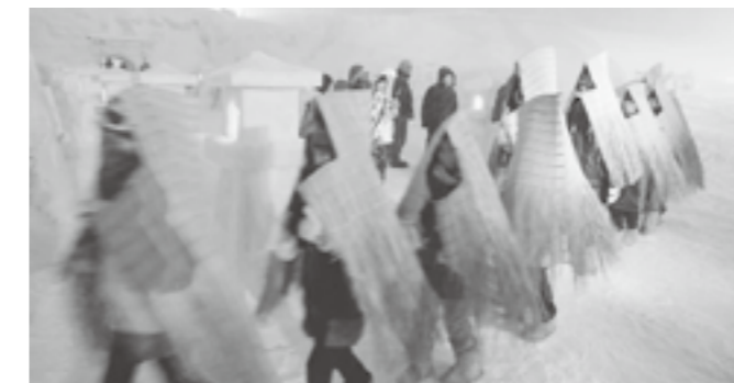
↑ 吹雪のなか、鳥追いをする狭山市から来た子どもたち