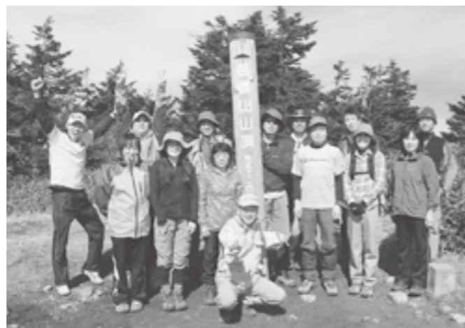
幅広い年代が参加した苗場登山。今年もやりますよ。

Tapの活動は、子ども向けのスポーツだけではなく、幅広い年代が、スポーツだけでなく、文化面でも活動に参加できるように考えています。たくさんのかたが、活動に参加することで、どんどん良い活動の輪が広がっていきます。みんなでTapの活動に参加しよう!!