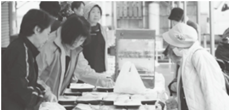
健康まつりで出店した店舗はどれも大人気でした。

津南町には、平成20年度に初めて2店舗の「健康づくり支援店」が誕生し、平成25年1月現在17店舗が指定されています。それぞれの店舗が「メニュー」等に関する栄養情報の提供などの支援のほか、地場産の旬の食材やこだわりの安心食材を使用し、健康に配慮したメニュー等を提供しています。健康的な食事が身近に利用でき、町民の皆さんの健康づくりを応援するお店です。ステッカーを目印にご利用ください。津南町では、こうした「健康づくり支援店」を平成26年度までに25店舗に増やす計画です。