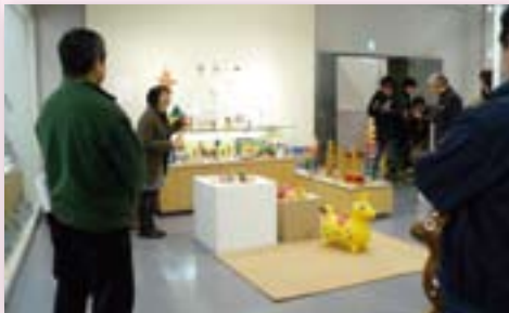
なじよもん友の会主催「Myコレクション展」