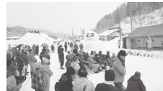
↑ 雪だるまや特設ステージが作られた旧上郷中グラウンド

昨年8月にできた上郷地区振興協議会による上郷地区の雪まつりが、旧上郷中のグラウンドで行われました。県境をまたいで親交の深い栄村からもたくさんの人が訪れ、上郷中学校が閉校し、途絶えていた交流行事の復活をよこしました。また特設滑り台では、中学生たちが小さな子どもたちの面倒をみる姿がみられ、上郷地区の絆の深さが感じられました。