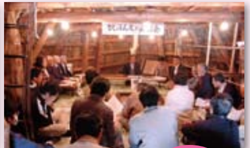
なじよもん友の会総会の様子