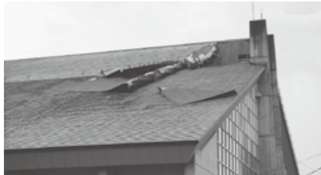
↑ 8月14日に強風でめくれあがった総合センターの屋根

新潟福島豪雨以降も、思わぬ災害が町を襲いました。8月14日に強風が吹き、総合センターの屋根がめくれあがりました。（9月末までには修理予定）