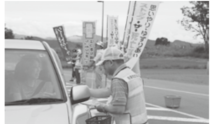
↑ ニュー・グリーンピアに来られたお客様に事故防止啓発チラシを配布する交通安全協会

十日町警察署管内で立て続けに起こった死亡事故に歯止めをかけるため、ニュー・グリーンピアへ来られたお客様に、事故防止の呼びかけを行いました。