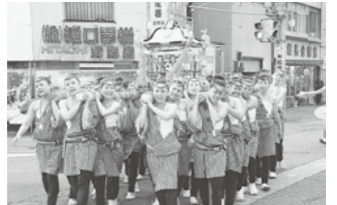
↑ 「ソイヤサツ」の掛け声とともに町内を練り歩く女神輿

県内でもめずらしい、女神輿が今年も行われました。年々、町中心部に限らず町内外から新しい担ぎ仲間が増えているというこの女神輿。休憩所で、パワーの源を注入し1日中、威勢のいい掛け声とともに町内を練り歩きました。