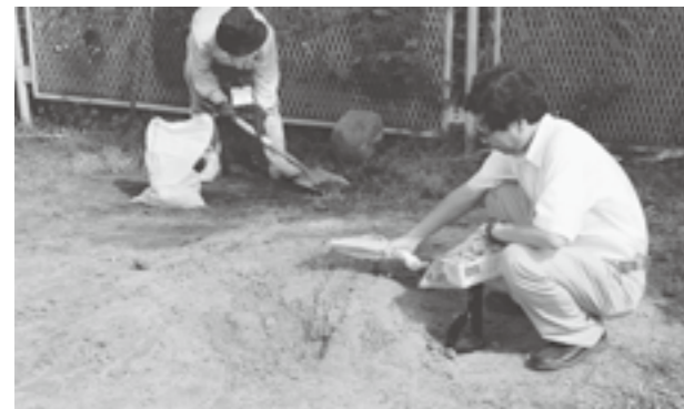
灰等を除去し、放射線量の測定を行いました。

放射線量が 高かった場所の対処 ひまわり保育園の、たき火跡では、0.32μSv/hの放射線量が測定されたため、立ち入り禁止措置をとり、県の指導立会のもと灰と土の除去を行いました。このたき火跡は、春先に保育園隣の林の杉葉を集めて燃やしたことで、他の場所と比べ、放射線量が高くなったものと思われず。 除去後の放射線量を測定したところ0.08μSv/hと通常の放射線量になりました。また、こばと保育園の堆肥所からは、0.2μSv/hと通常時より若干高め放射線量が測定されましたが、安心のために撤去いたしました。