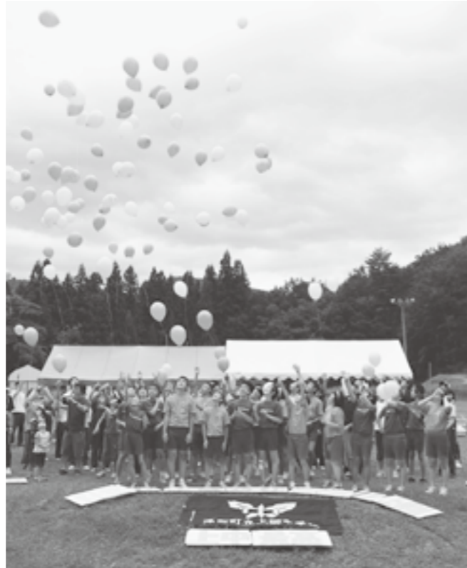
↑ 来春閉校する上中への思いを書き入れた風船を飛ばす生徒たち

来春閉校する上郷中学校最後の体育祭が行われ、23名の生徒たちが地域のかたといっしょに力いっぱい競技を行いました。