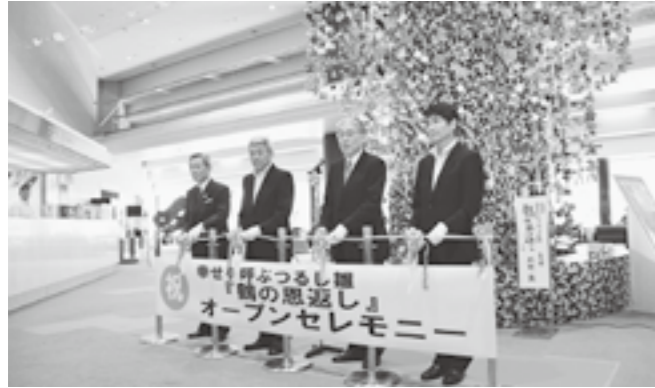
↑ ニュー・グリーンピアで行われたセレモニー