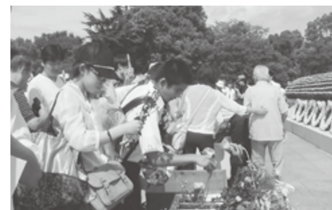
↑平和記念式典で献花する中学生の皆さん