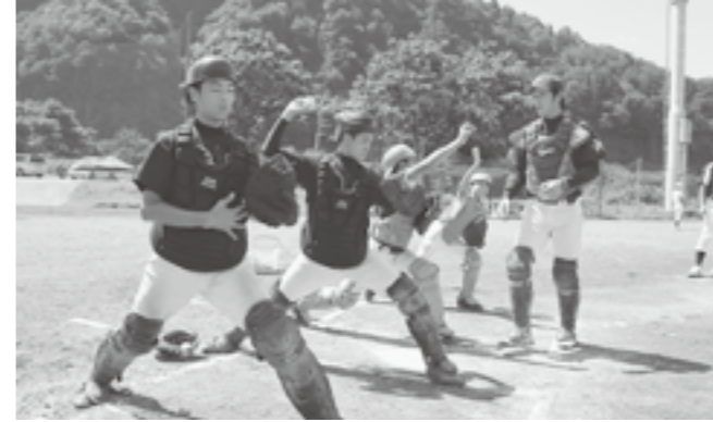
↑ キャッチャーの専門技術を教わる子どもたち

社会人野球チーム・バイタルネットの選手を招いた野球教室が開催されました。選手はポジションごとに具体的な動作を現役選手から真剣に教えてもらいました。