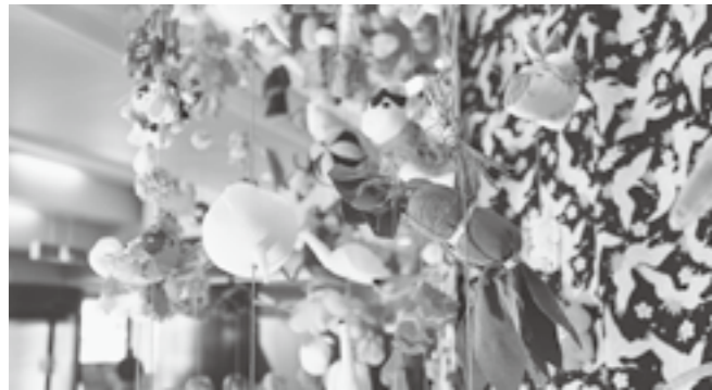
↑ 108種類の手作り雛。笹団子など地域色のある雛もあります

一つひとつが手作りの雛 3039 個からなる「つるし雛」が「NPO法人 日本つるし雛協会（北野辰会長）」から町へ寄贈されました。寄贈された「幸せを呼ぶつるし雛 / 鶴の恩返し」は、この震災で再認識された、夫婦や親子、友人との「絆」を作品のテーマにして作られています。108 種類の雛の中には、ひまわりや笹団子、へぎそばなど新潟津南を題材にしたものもあり、一つひとつ見ているだけで、とても幸せな気持ちにさせてくれます。作品は、ニュー・グリーンピアのロビーに飾られていますので、皆さんもぜひご覧ください。