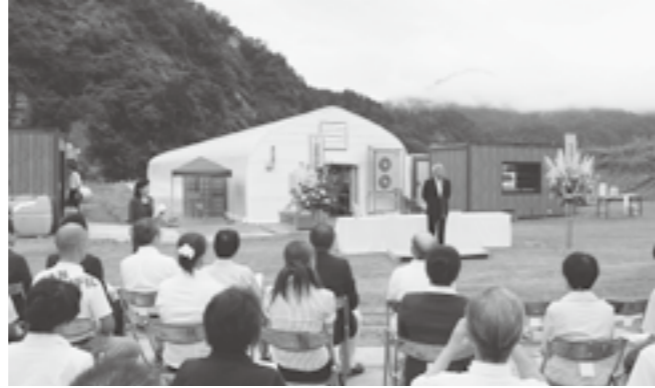
↑ 9月1日に行われた開所式。写真奥がきのこ工場です。

最低賃金を保障する福祉作業施設として、きのこ工場が大割野に開所しました。この施設は、株式会社サンファームが2年前から準備を進め、この夏に操業を開始しました。障害者の雇用が進まないなか、最低賃金を保障することで障害者自らが働き得た収入で自立を目指していきます。就業予定者は、津南町5名十日町市13名南魚沼市2名で、今後、きのこ施設を増やし雇用者数を増やしていく予定です。