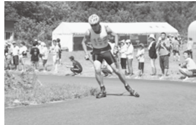
↑ 前回の冬期オリンピックに出場した恩田祐一選手

マウンテンパーク津南でミニバイアスロン大会とローラースキー大会が開催されました。ローラースキー大会には、前回オリンピック出場の恩田祐一選手や木村正哉選手など国内トップクラスの選手が出場し、国際レベルの走りを披露しました。