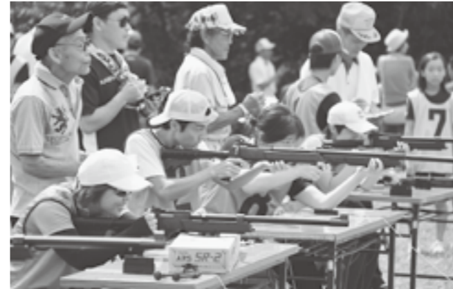
↑ 真剣にエアガンで的を狙うミニバイアスロン参加者