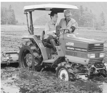
80歳から22歳へ受け継がれる農業

町長 生産から集荷までは、集荷会社が栽培履歴を把握し、集荷から消費までは、大部分が市場や小売を通じて把