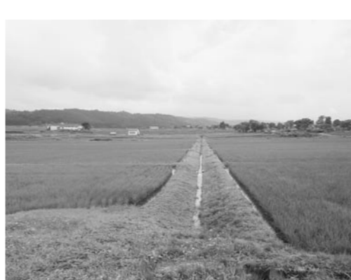
今では20a区画の圃場も非効率的

問 初期に行った基盤整備は、圃場面積や設備が時代に合わない。再整備すべきと思うがどうか。