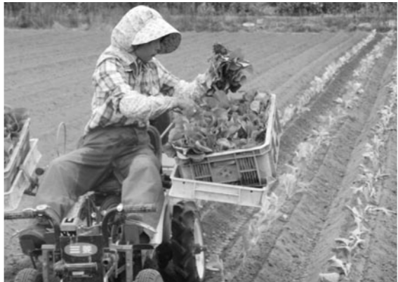
機械化によるキャベツ植栽

判定が難しいため、時期尚早として見送つた次第である。 津南野菜をブランド化するため、JAはじめ、関係業者がまとまり、統一シールを貼り販売を行っているところである。