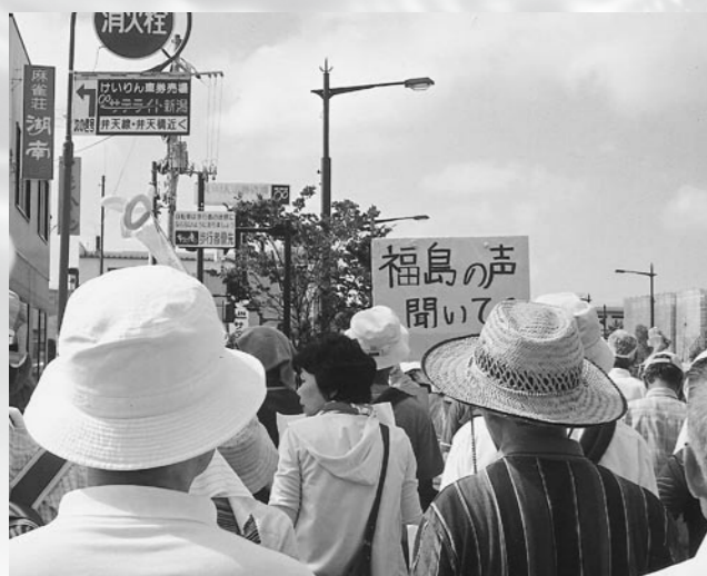
原発ゼロのデモ行進(新潟市)

原発再稼働反対の意見書に対し、活発な議論がかわされました。反対9、賛成6により意見書は否決されました。