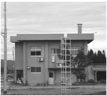
県内で一番標高の高い観測所(452m)

町長 豪雪は暗いというマイナスイメージだけにとらえず、雪が多いからきれいな水があると置き換えると、受け止める感性も違う。