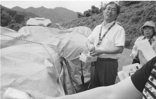
福島県を視察：除染を進めている伊達市。除染費用400億円(表土の仮置き場)

町長 県は福島原発事故の検証が明らかにされない中での再稼働は認められないとしており、動向を注視している。 問 柏崎刈羽原発で重大事故が起きた場合、放射能被害の予測がされているのか、30km圏内に住む80万人の住民が