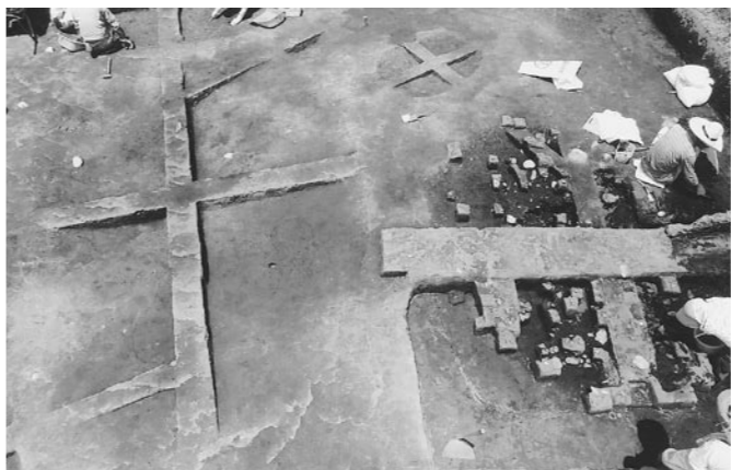
7,000年前の住居遺跡(割野地区)