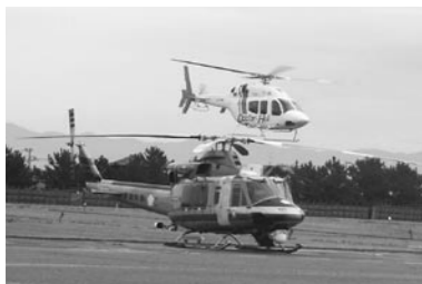
人命を救うドクターヘリと防災ヘリ

町長 集落の街灯や庁舎の照明の切替えはLEDの価格が下がってきたら逐次取り換えを進めたい。