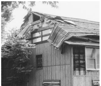
各地に点在する空き家