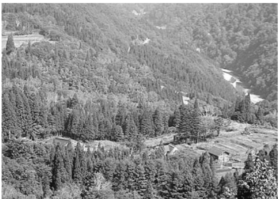
過疎化が進む集落

町長 157行政区の約7割が準限界・限界集落であり様々な施策の構築が必要である。同時に町民所得の向上を進めなければならないと思っている。集落の自治機能を支えるにあたって