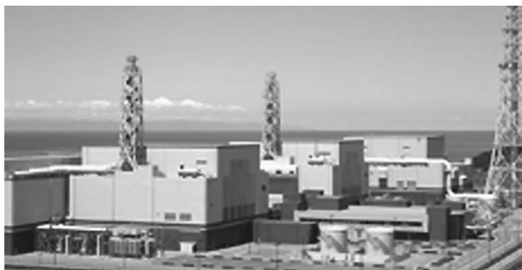
柏崎刈羽原子力発電所

教育長 「ようこそ先輩シリーズ」で講演会をおこなっている。郷土の偉人については「津南学」で紹介し、子供達にその副読本を作成予定である。自然体験は安全第一であり、家庭・地域で育てることが望ましい。