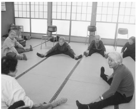
サロン事業で介護予防

町長 十分とは言えないが、健康寿命の延伸につながっている。介護予防事業は町政の最も肝要な施策であり、今後も効果的な展開をしていく。2次予防事業は6月から地区公民館を4か所増やして実施していく。又、サロン事業はボランティアの育成が今後の課題であり、寝たきり0運動は、男性の参加者を健康診断の会場等で呼びかけていく。